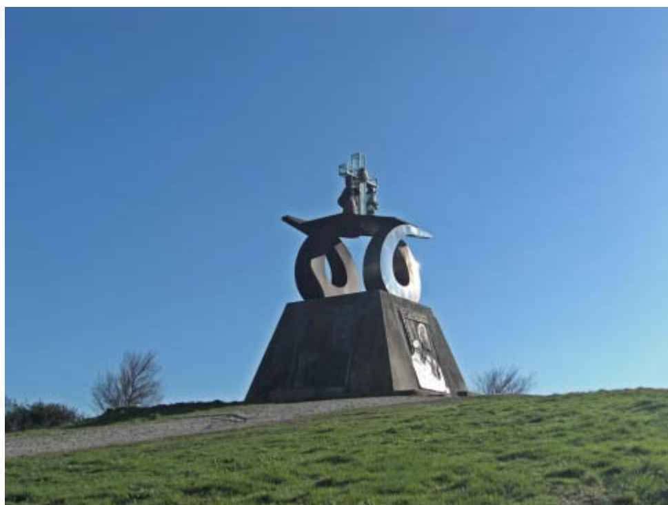
Monte do Gozo